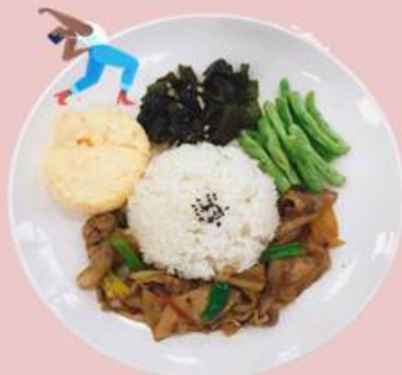
B餐 謝欣淇 來份蔥爆豬喼 $75