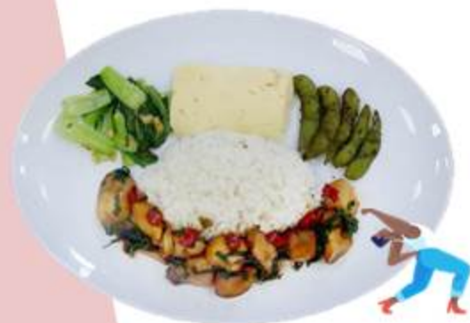
C餐 王建凱 來份菇菇寶貝喼 $75