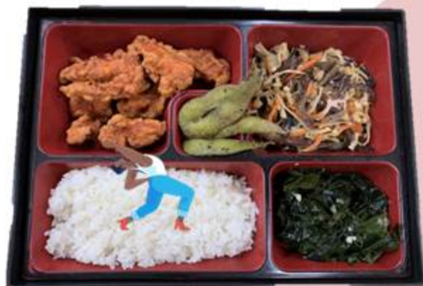
A餐 詹宜潔 來份唐揚雞喼 $75